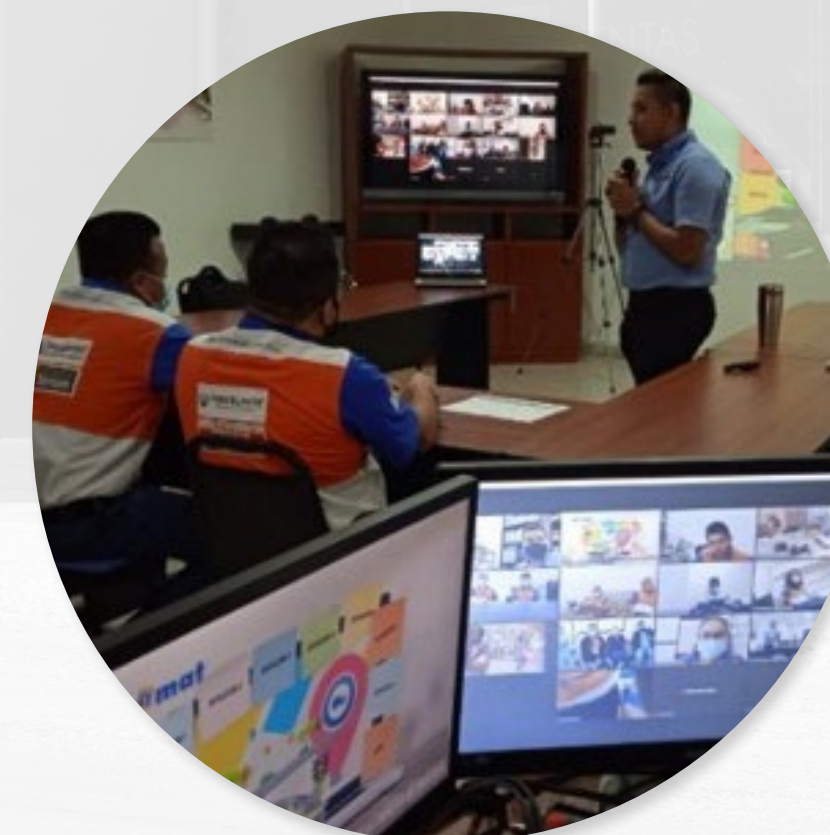
INCIDENCIAS EN ENTREGA DE MATERIAL