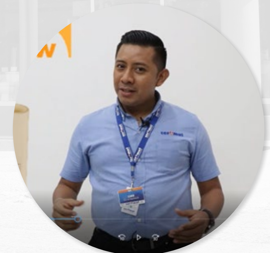
VIDEOS DIDÁCTICOS CAMPAÑA DE FONTANERIA