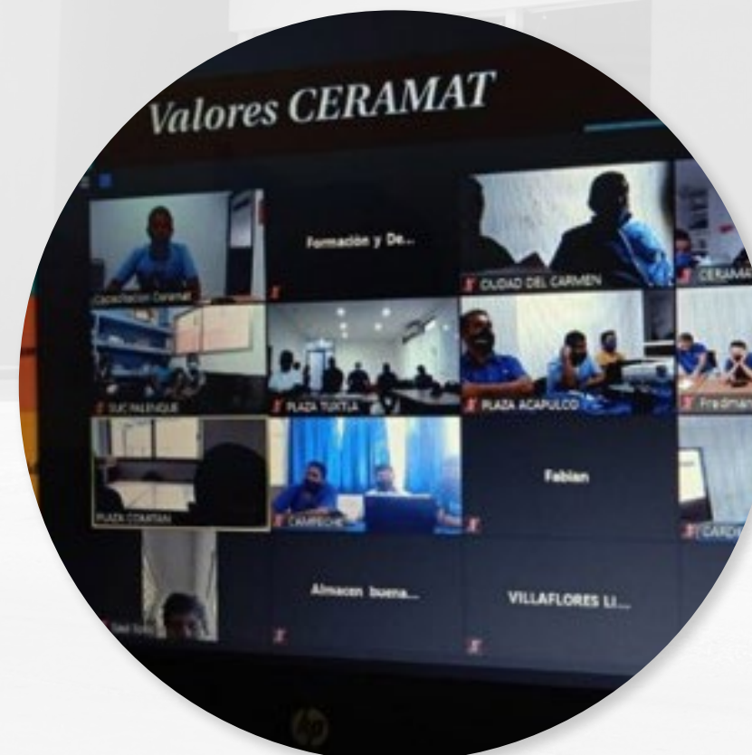
CURSOS EN LÍNEA ACTITUD CERAMAT - ALMACÉN