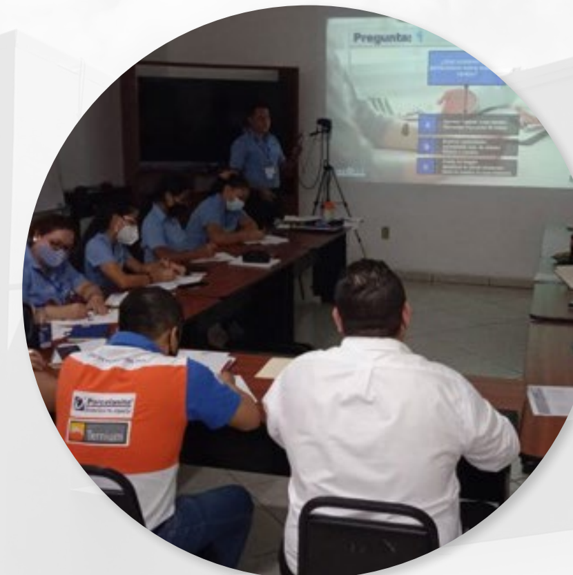
CLINICA DE VENTAS RETAIL