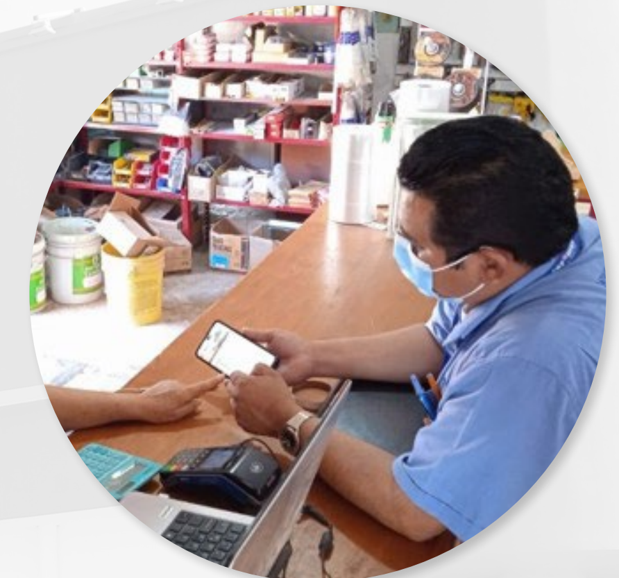
FORMACIÓN EN CAMPO PROCESO DE VENTAS MAYOREO