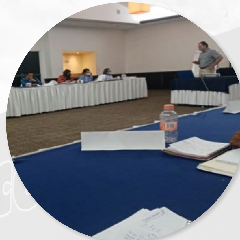
GESTIÓN DE VENTAS MAYOREO

Con el objetivo de mantener calidad y una cultura de servicio, ceramat ejecuta estratégicamente programas de formación, que permiten fomentar el buen desempeño, destrezas y habilidades que fomentan las buenas relaciones laborales.